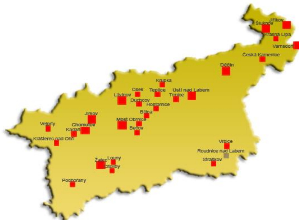
Obrázek P1 – mapa sociálně vyloučených lokalit v Ústeckém kraji