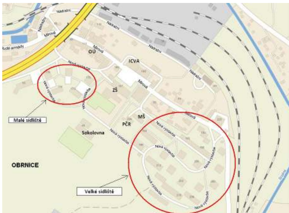
Obrázek 2 - mapa sociálně vyloučených lokalit v Obrnicích - upravit

Pro stanovení sociálně vyloučených lokalit byla využita identifikace v rámci tzv. Gabalova výzkumu 8 z roku 2006. Jedná se o dvě části obce, která splňují charakteristiku vyloučené lokality, a to o Velké sídliště a Malé sídliště.