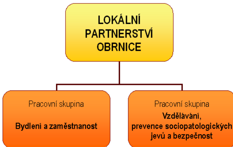
Obrázek 1 – Schéma lokálního partnerství Obrnice

Lokální partnerství je tvořeno partnerstvím zástupců obce, veřejné správy, nevládních organizací, škol a podnikatelů a dalších partnerů, kteří mohou být angažováni v procesu sociálního začleňování. Bylo ustanoveno na svém úvodním jednání dne 10. června 2010 a řídí se jednacím řádem, který byl schválen na druhém jednání lokálního partnerství dne 15. září 2010. Počet členů Lokálního partnerství prezentuje široké spektrum oblastí, které Lokální partnerství pokrývá. Dalšího rozvoje vysokého potenciálu a kreativity tohoto uskupení lze dosáhnout vzájemnou spoluprací a koordinací.